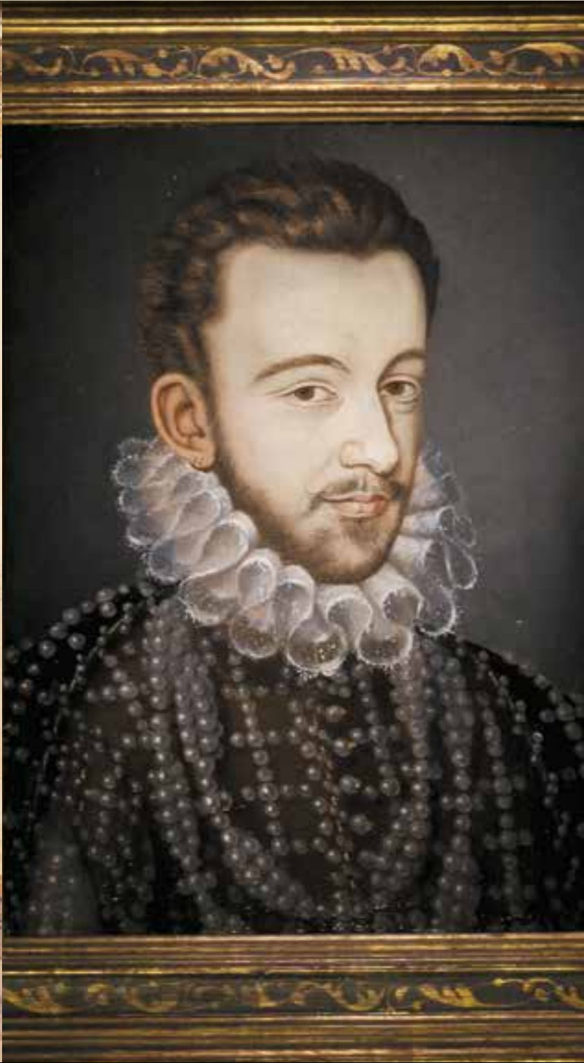
亨利三世画像 弗朗索瓦·克鲁埃

舍农索城堡里收藏着丰富的珍宝与杰作：大师名匠精心奉上的挂毯、油画、家具：弗朗索瓦·克鲁埃，牟利罗，丁托列托，尼古拉·普桑，柯勒乔，鲁本斯，普希马蒂斯，凡·罗的作品“美慧三女神”……。