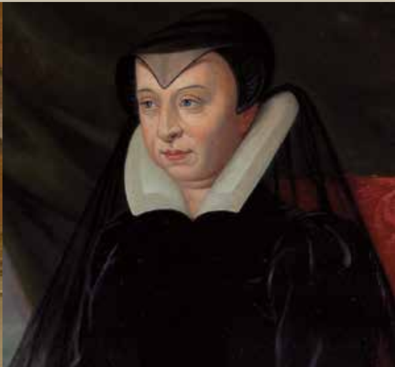
卡特琳·德·梅迪西斯