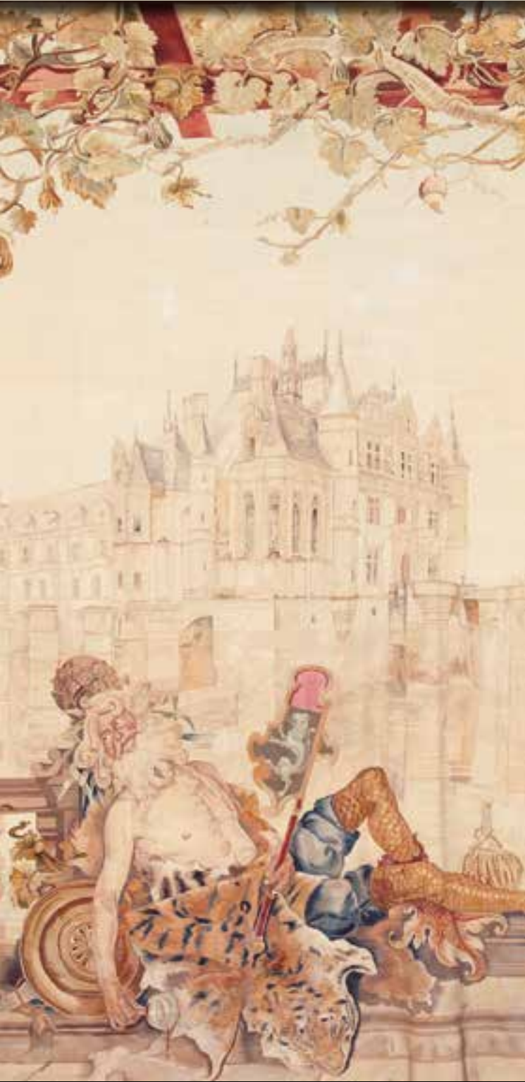
十九世纪讷依工厂出品的挂毯“舍农索和谢尔河的传说”瓦尔梅兹